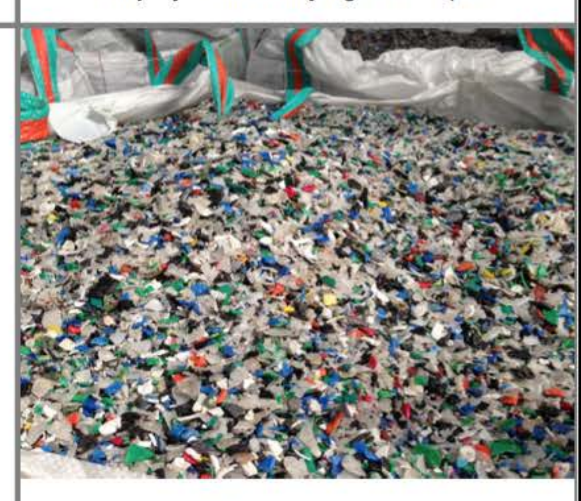
Skupujemy odpady hdpe

Produkcja kanistrów możliwa jest dzięki realizacji Projektu "Wdrożenie nowej technologii produkcji pojemników z dodatkiem porowatego kompatybilizatora pochodzenia wulkanicznego", współfinansowanego w ramach Działania 4.3 "Kredyt technologiczny", Programu Operacyjnego Innowacyjna Gospodarka, 2007 – 2013 (zgodnie z umową o finansowanie nr POIG.04.03.00-00-918/11-00)