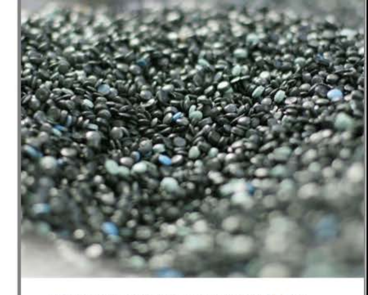
Produkujemy i dostarczamy regranulat hdpe

Wytrzymałość Ergonomia Jakość Kolorystyka Ekologia