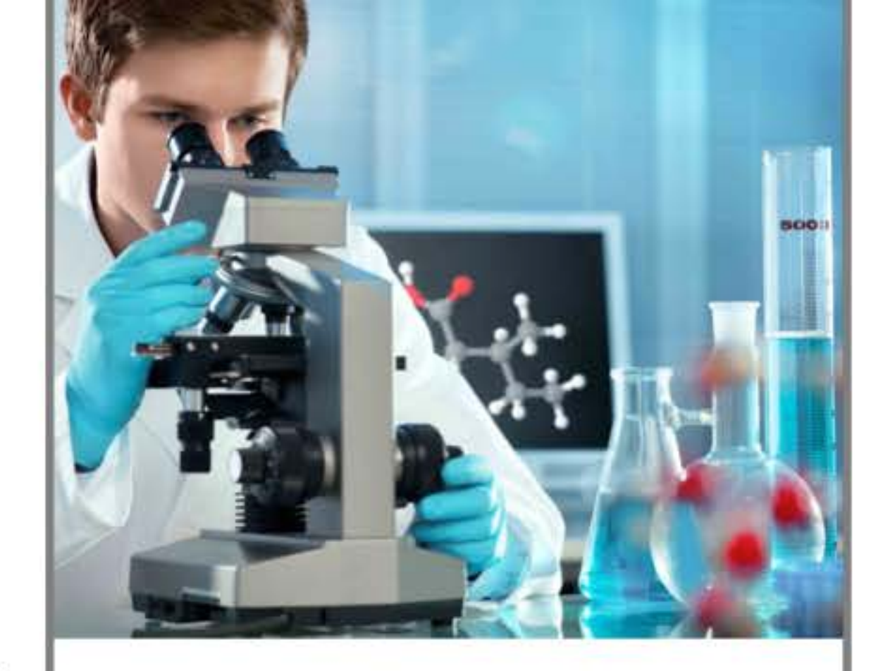
Gwarantujemy jakość w normie UN 3H1/Y1.9/150

Jesteśmy wiodącym producentem kanistrów HDPE w Europie Środkowej. Dzięki inwestycji w nowoczesne technologie, profesjonalną kadrę oraz sprawdzony materiał HDPE (granulat i regranulat) produkujemy kanistry plastikowe HDPE, spełniające najwyższe normy jakości (w tym normę UN 3H1/Y1.9/150) i przystosowane do bezpiecznego przechowywania najtrudniejszych nawet płynów.